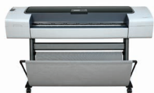
Imprimante HP Designjet T1120 44"