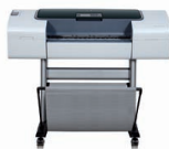
Imprimante HP Designjet T1120 24"

Étonnez vos clients avec cette imprimante HP Designjet en créant des résultats de qualité professionnelle aux couleurs éclatantes, et tenez des délais serrés grâce à la rapidité d'impression. Les fonctions de performances offrent les résultats attendus, et permettent de contrôler et gérer plus facilement l'imprimante.