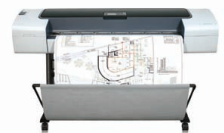
Imprimante HP Designjet T1120ps 44"

Idéale pour les groupes de travail exigeants en pleine expansion souhaitant créer des présentations éclatantes en interne et dans les délais.