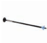
Q6709A Mécanisme d'avance de rouleau 44 pouces HP Designjet