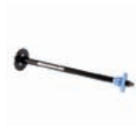
Q6700A Spindle 24 pouces HP Designjet Zx100/Tx100/Tx10