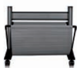
Q6663A Socle HP Designjet Zx100/Tx100/Tx10 24 pouces