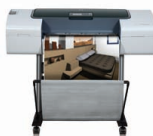
Imprimante HP Designjet T1120ps 24"